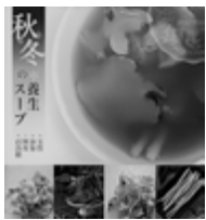
秋冬薬膳養生 スープキット 918円