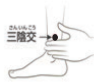
三陰交 (さんいんこう)

ウエストの一番くびれた部分の背骨両脇にあるつぼ。腰に手を当てグッと押ししたり、体を後ろに反らしても。気を温めるツボです。