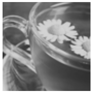
カミツレ (カモミール) 30g : 432円

ハーブの中では誰もが知るカモミール。日本ではカミツレ、中国で母菊といいます。甘酸っぱいリンゴのような優しい香りがします。ヨーロッパでは古くから、安眠、下痢や腹痛など消化器症状に使われたり、軽く発汗させる働きがあることから風邪の初期や冷え症に使われてきました。平滑筋の緊張を和らげるので胃痛、生理痛にもおすすめ。カミツレは以前は薬として日本薬局方に収載され、イギリスやドイツでも国の薬局方に収載されている実力派。お風呂に入れると芯から温まり、肌荒れが緩和しますよ。