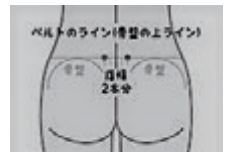
大腸俞(だいちょうゆ)

おへその両横、指幅3本外側にあります。 おなかの張った時によく圧痛を強く感じます。 特にお灸がおすすめですよ。