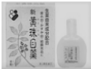
おうじゅめくすり 黄珠目薬 15ml：1320円